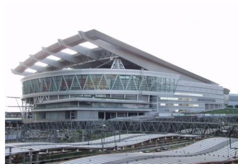
(さいたま市：さいたまスーパーアリーナ)