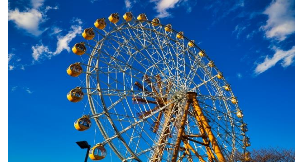
(南埼玉郡：東武動物公園)