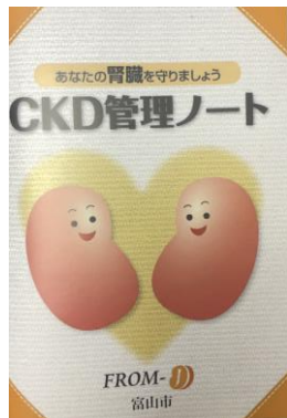
富山市の保健指導ツール