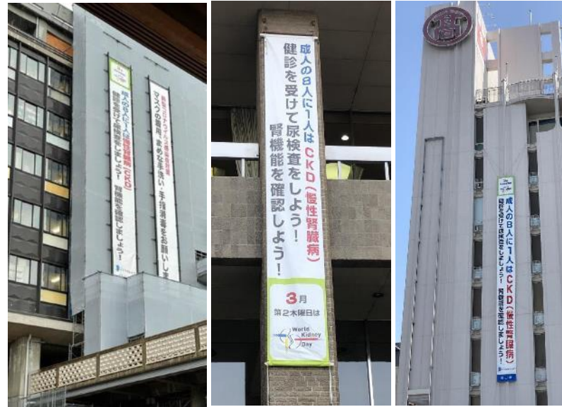
世界腎臓デーにあわせた啓発イベント