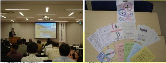
▲14年度説明会 ▲15年度説明会