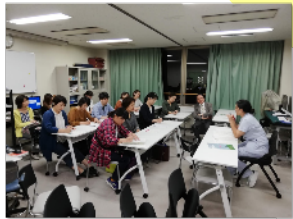
2019年9月大学病院カンファレンスルームにて