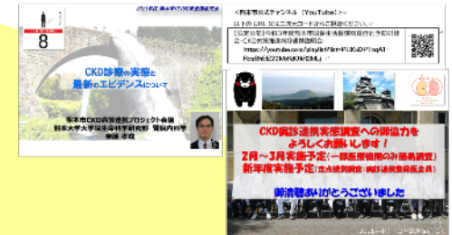
PDCAサイクルを回す施策 ～その2～