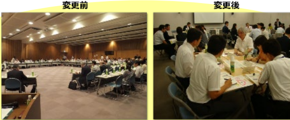
変更前 変更後 PDCAサイクルを回す施策 ～その1～

令和2年度 厚生労働行政推進調整事業補助金 (腎臓病政策研究事業) 「腎臓病対策検討会報告書」に基づく対策の進捗管理および新たな対策の提案に資するITシステム構築 令和2年度 厚生労働科学研究費補助金 (腎臓病政策研究事業) 「慢性腎臓病 (CKD) に対する全国での普及啓発の推進、地域における診療連携体制構築を介した医療への貢献」