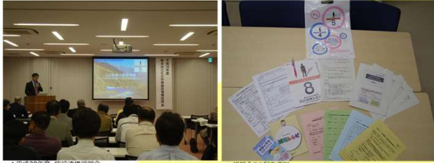
▲平成28年度 病診連携説明会