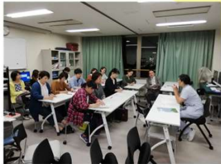
2019年9月大学病院カンファレンスルームにて